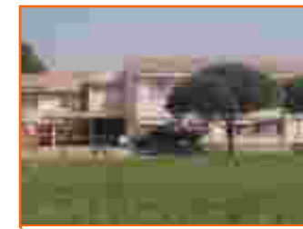
Via Gobbi, 13 Favaro Veneto tel. e fax 041630704 mail: primariafucini@gmail.com

4 collaboratori scolastici di cui 1 part-time