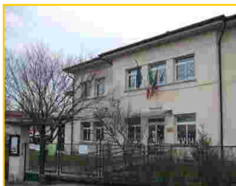
V. Triestina, 140 - Tessera tel. e fax 0415415018 mail: primariacolodi@gmail.com

2 collaboratori scolastici (martedì e venerdì è presente 1 solo collaboratore scolastico)